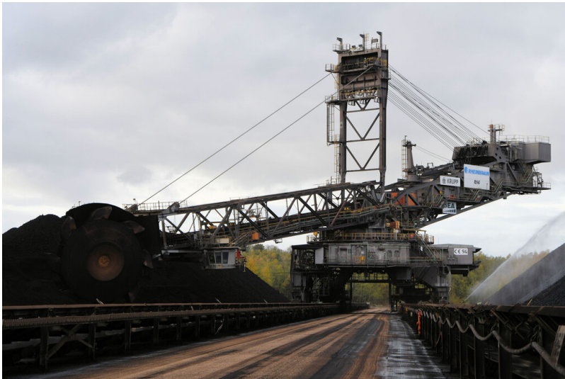
Tagebau Hambach: Schaufelrad-Aufnahmegerät 814 im Kohlebunker Hambach; Foto: 07.11.2022