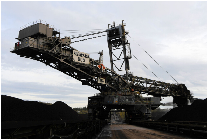
Tagebau Hambach: Schaufelrad-Aufnahmegerät 809 in Bunker 1; Foto: 07.11.2022