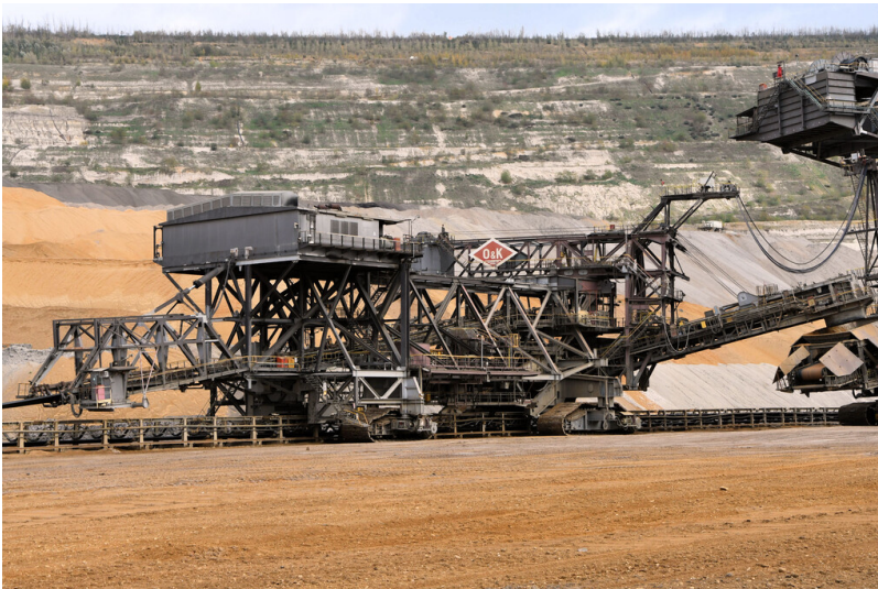
Tagebau Hambach: Bandschleifenwagen 949 mit Auflaufteil und Schwenkbandausleger; Foto: 07.11.2022