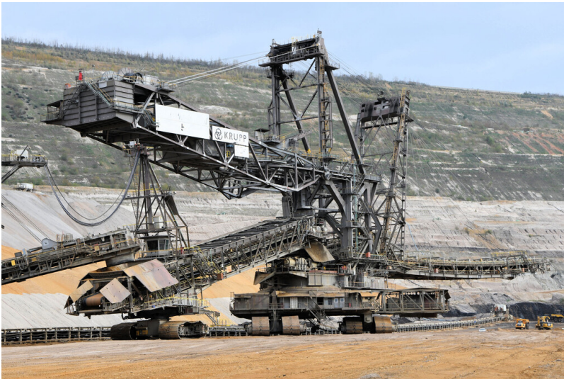
Tagebau Hambach: Absetzer 758; Foto: 07.11.2022