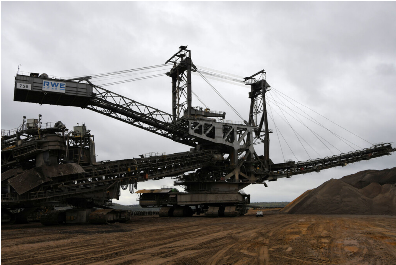
Tagebau Hambach: Absetzer 756 mit 100 m langem Abwurfausleger