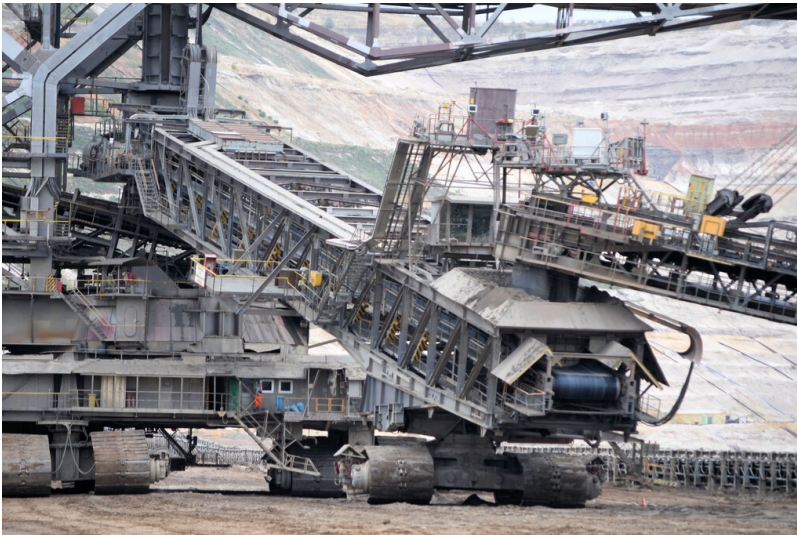
Tagebau Hambach: Absetzer 739, auf Raupenwagen abgestützter Zubringerausleger und Übergabevorrichtung von Bandschleifenwagen 944; Foto: 07.11.2022