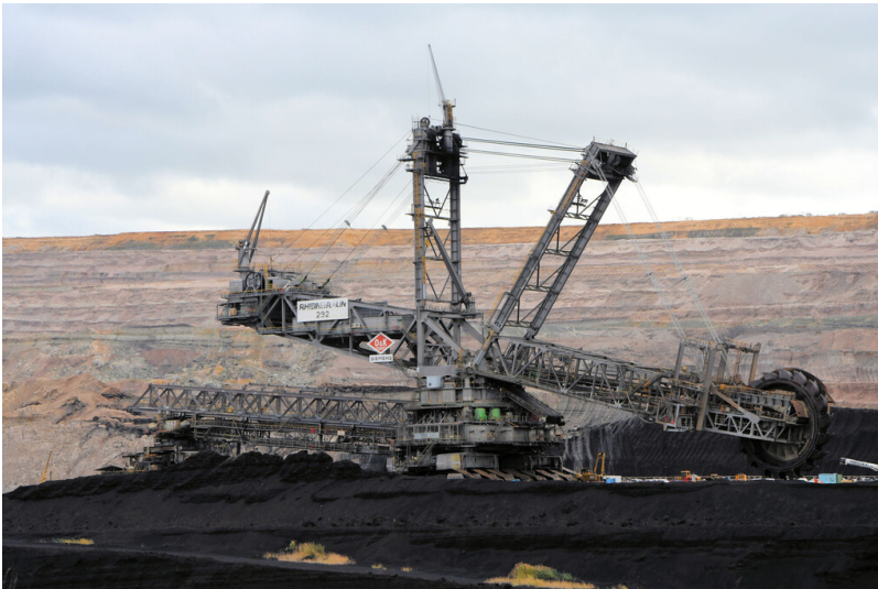
Tagebau Hambach: Schaufelradbagger 292; Foto: 07.11.2022