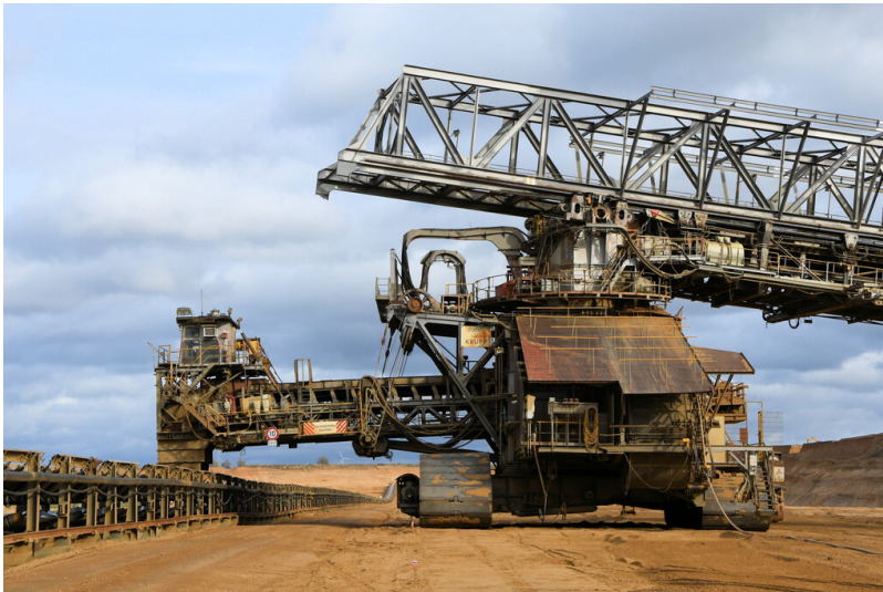
Tagebau Hambach: Schaufelradbagger 291, Bandbeladewagen mit Übergabeausleger und Bandbeladepkopf; Foto: 07.11.2022