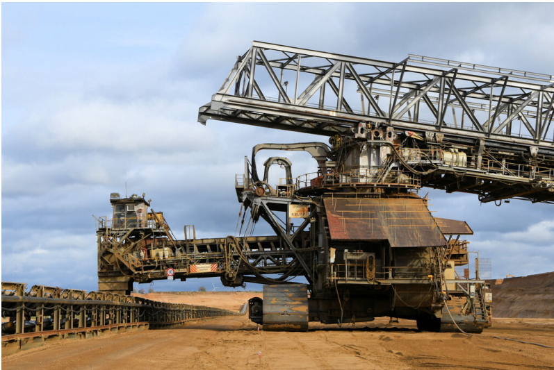
Tagebau Hambach: Schaufelradbagger 291, Bandbeladewagen mit Übergabeausleger und Bandbeladekopf