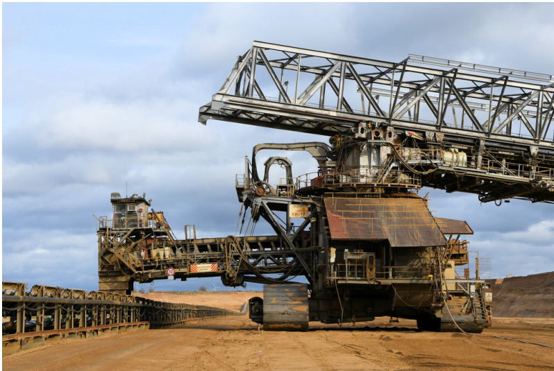
Tagebau Hambach: Schaufelradbagger 291, Bandbeladewagen mit Übergabeausleger und Bandbeladekopf