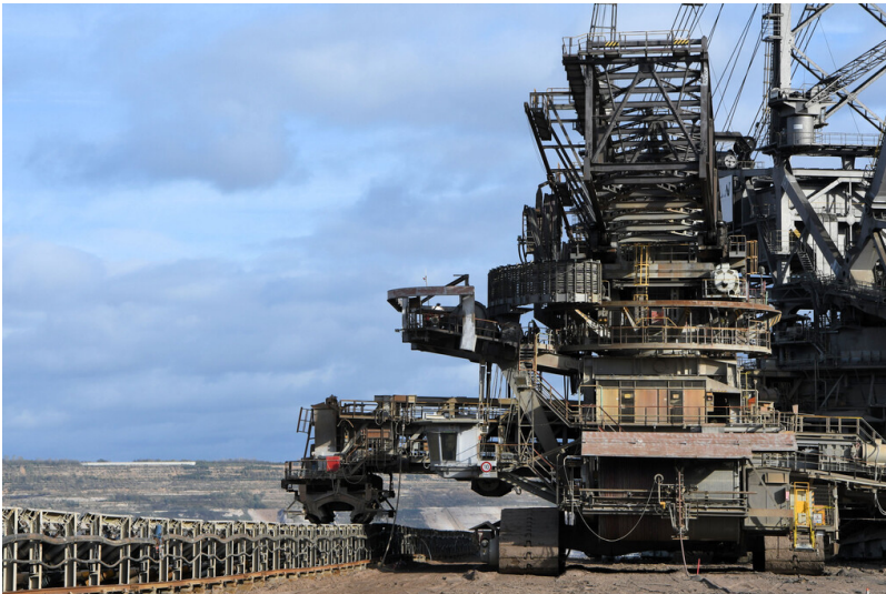
Schaufelradbagger 290: Bandbeladewagen mit Übergabeausleger und Beladekopf; Foto: 07.11.2022