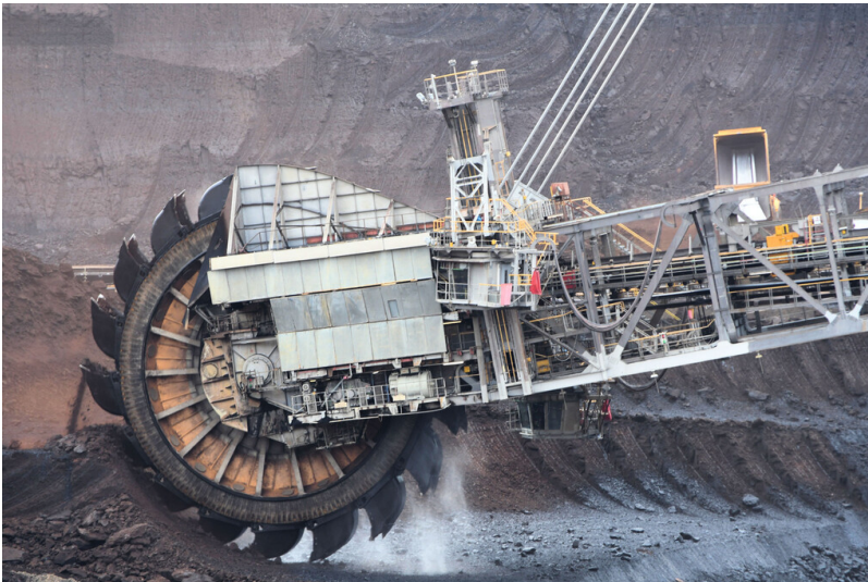
Tagebau Hambach: Schaufelradbagger 289, Schaufelrad mit Antriebsvorrichtung; Foto: 07.11.2022