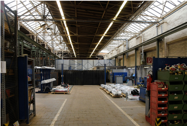
Tagebau Garzweiler: Mechanische Werkstatt, Halleninnenraum, Ansicht von Nordwesten; Foto: 26.06.2023