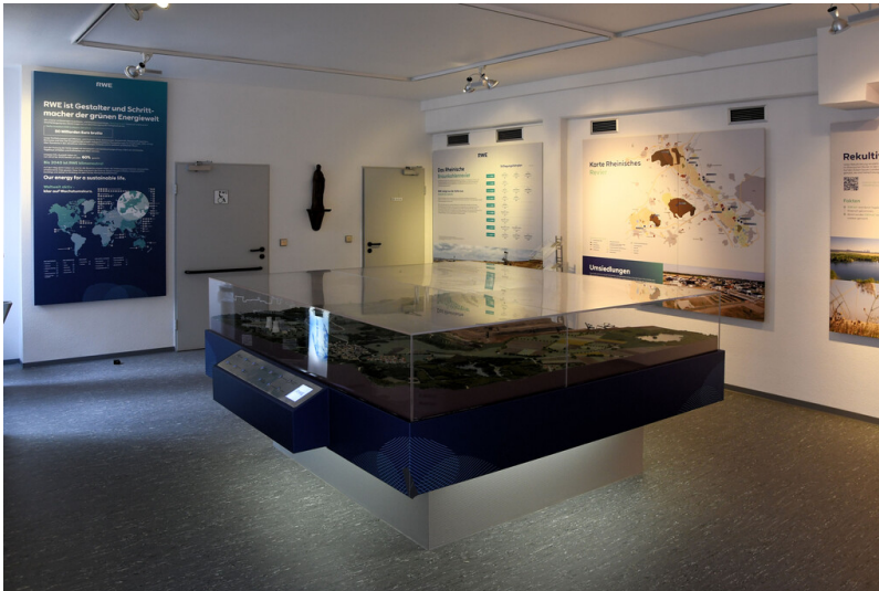
Tagebau Garzweiler: Info-Center des Tagebaus Garzweiler, Eingangshalle; Foto: 26.06.2023