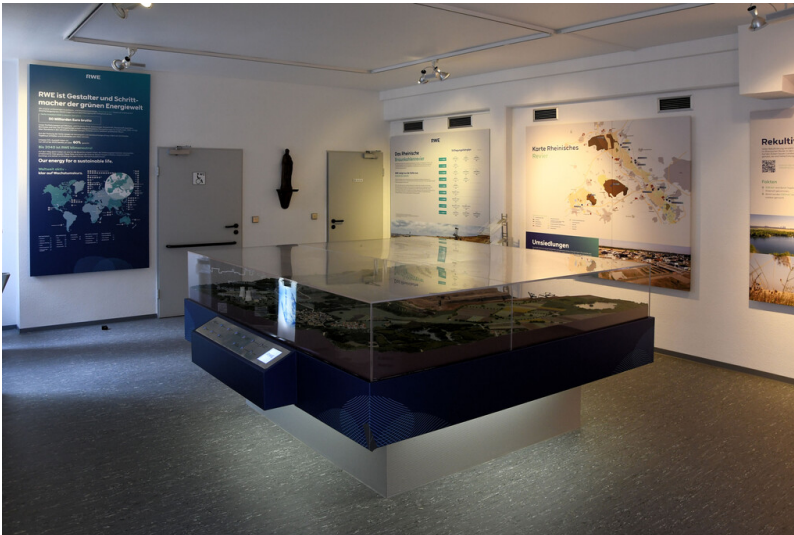
Tagebau Garzweiler: Info-Center des Tagebaus Garzweiler, Eingangshalle; Foto: 26.06.2023