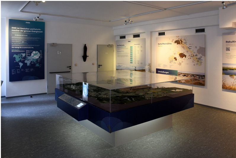
Tagebau Garzweiler: Info-Center des Tagebaus Garzweiler, Eingangshalle