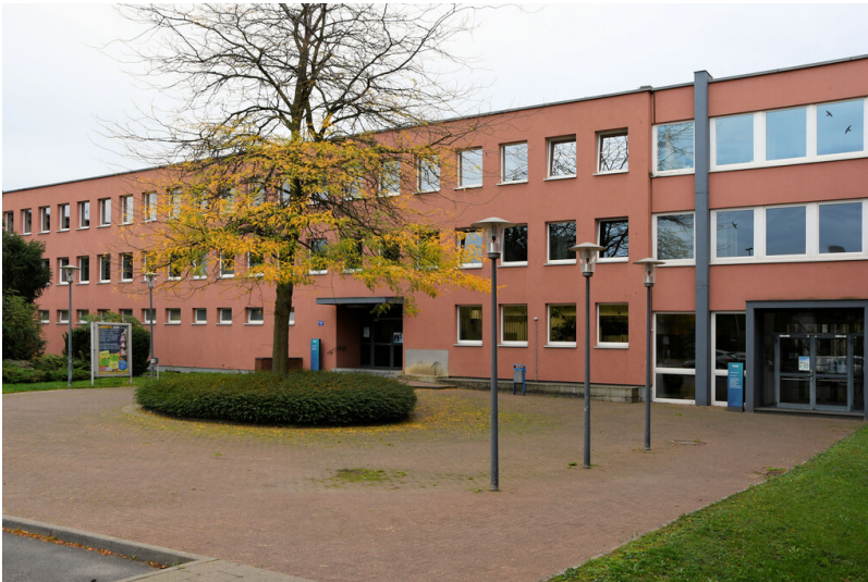
Tagebau Garzweiler: Tagebauverwaltung, ehemaliges EA-Gebäude, Ansicht von Norden; Foto: 03.11.2022