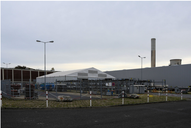
Tagebau Garzweiler: Materiallagerplatz, Ansicht von Südwesten; Foto: 03.11.2022