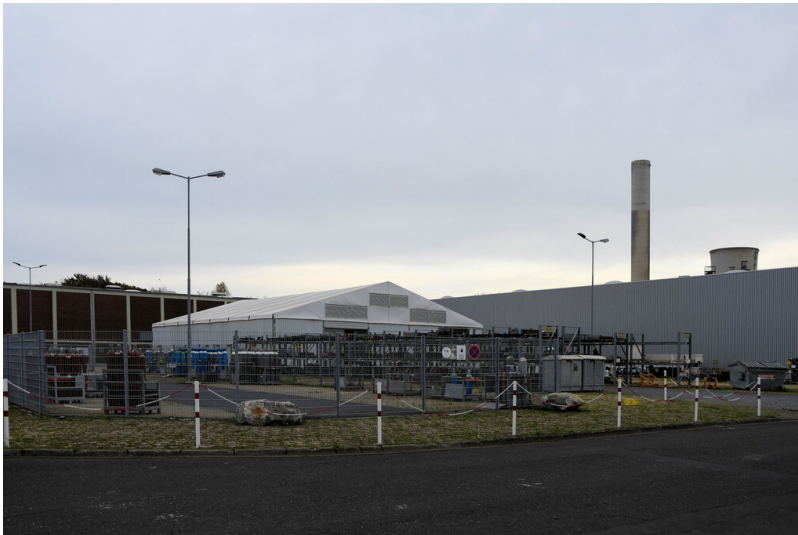
Tagebau Garzweiler: Materiallagerplatz, Ansicht von Südwesten