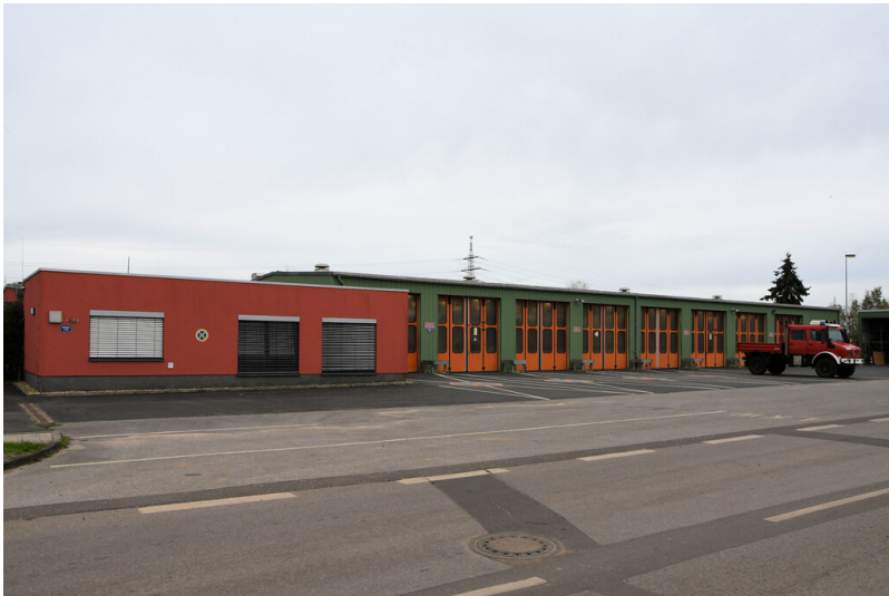
Tagebau Garzweiler: Feuerwehr- und Sanitätsstützpunkt, Ansicht von Osten