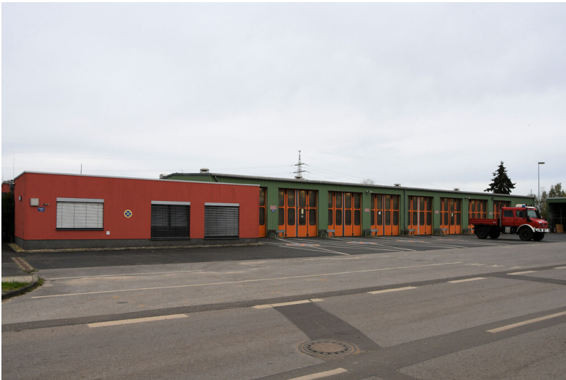
Tagebau Garzweiler: Feuerwehr- und Sanitätsstützpunkt, Ansicht von Osten