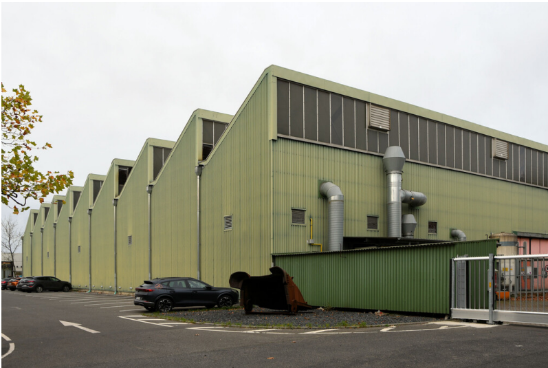
Tagebau Garzweiler: Ausbildungsstätte Gustorf, Ansicht von Nordosten; Foto: 03.11.2022