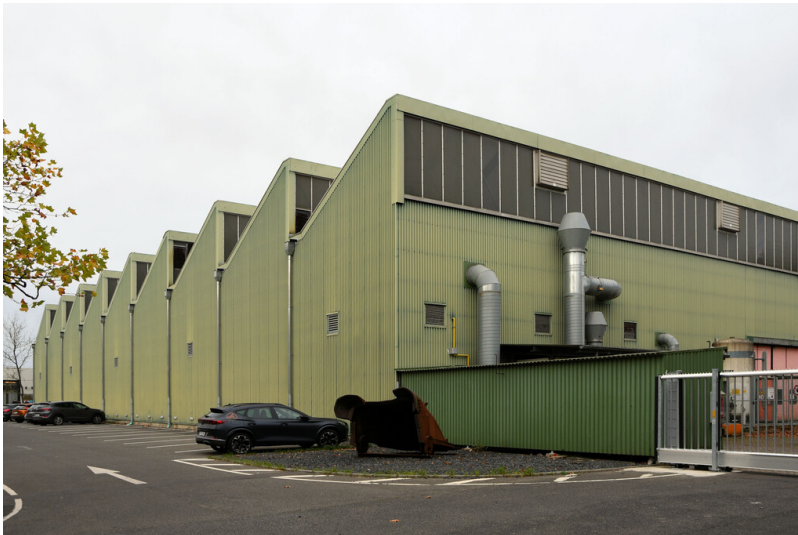
Tagebau Garzweiler: Ausbildungsstätte Gustorf, Ansicht von Nordosten; Foto: 03.11.2022