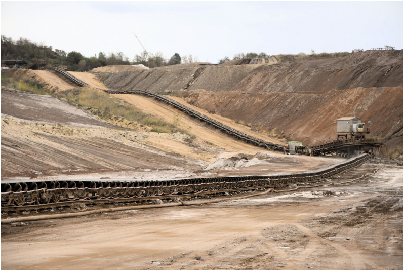
Tagebau Garzweiler: Aschebandanlage in der Kraftwerksrückstandsdeponie, Ansicht von Osten