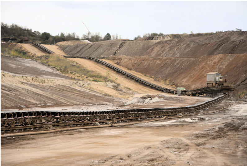
Tagebau Garzweiler: Aschebandanlage in der Kraftwerksrückstandsdeponie, Ansicht von Osten