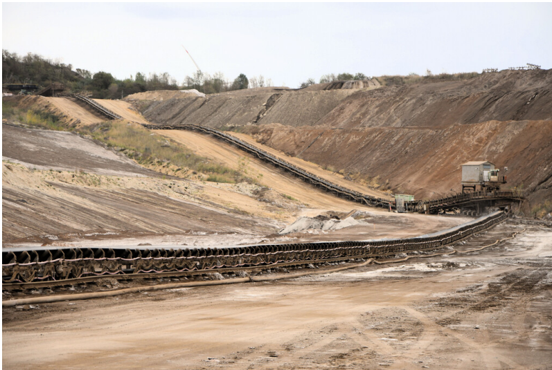
Tagebau Garzweiler: Aschebandanlage in der Kraftwerksrückstandsdeponie, Ansicht von Osten