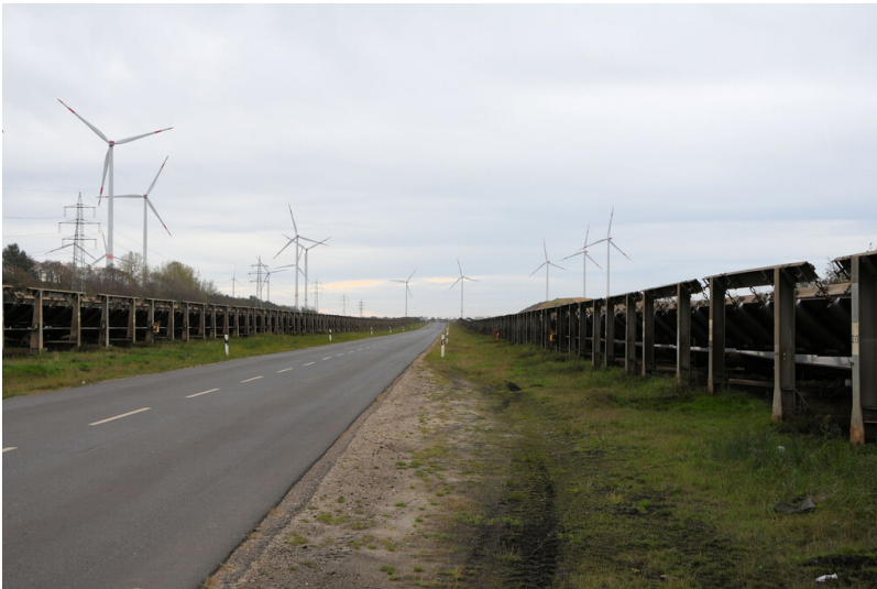
Tagebau Garzweiler: Bandanlage vom BSP Jackerath zum BSP Kohlebunker West, Ansicht von Norden; Foto: 03.11.2022