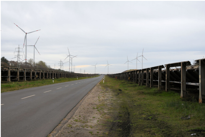
Tagebau Garzweiler: Bandanlage vom BSP Jackerath zum BSP Kohlebunker West, Ansicht von Norden; Foto: 03.11.2022