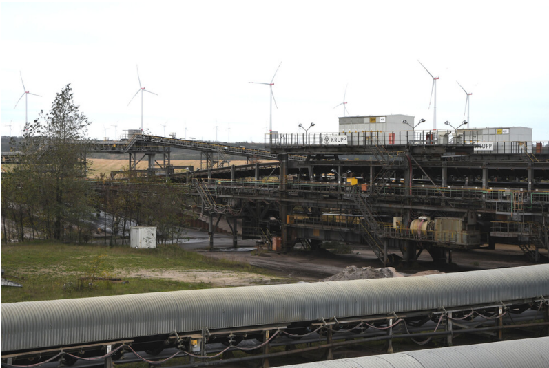
Tagebau Garzweiler: Verschiebeköpfe am Bandsammelpunkt Kohlebunker West, Ansicht von Nordosten; Foto: 03.11.2022