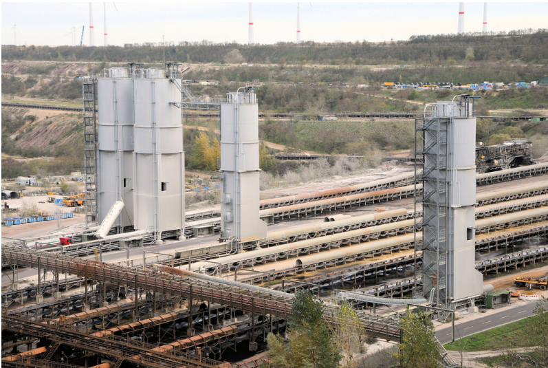
Tagebau Garzweiler: Silo- und Kompressoranlage am Bandsammelpunkt Jackerath, Ansicht von Südwesten; Foto: 03.11.2022