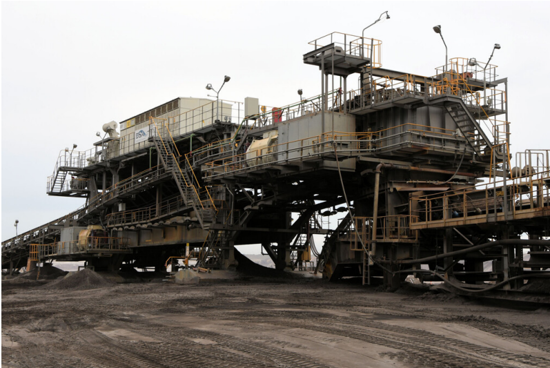
Tagebau Garzweiler: Bandantriebsstation 4 x 1.500 kW für Bandanlage B 2800