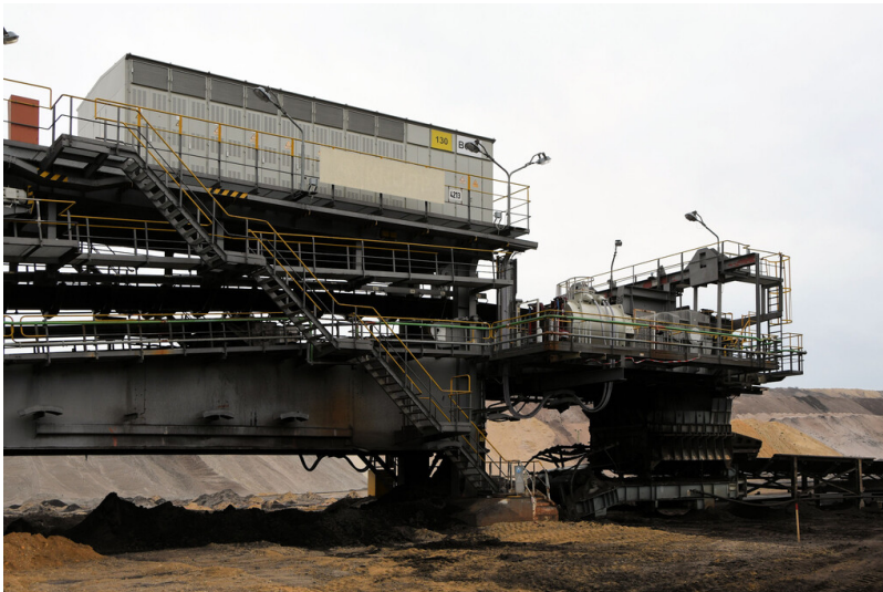
Tagebau Garzweiler: Bandantriebsstation 4 x 1.500 kW (Bandanlage 2200), Aufgabeschurre auf das abgehende Band