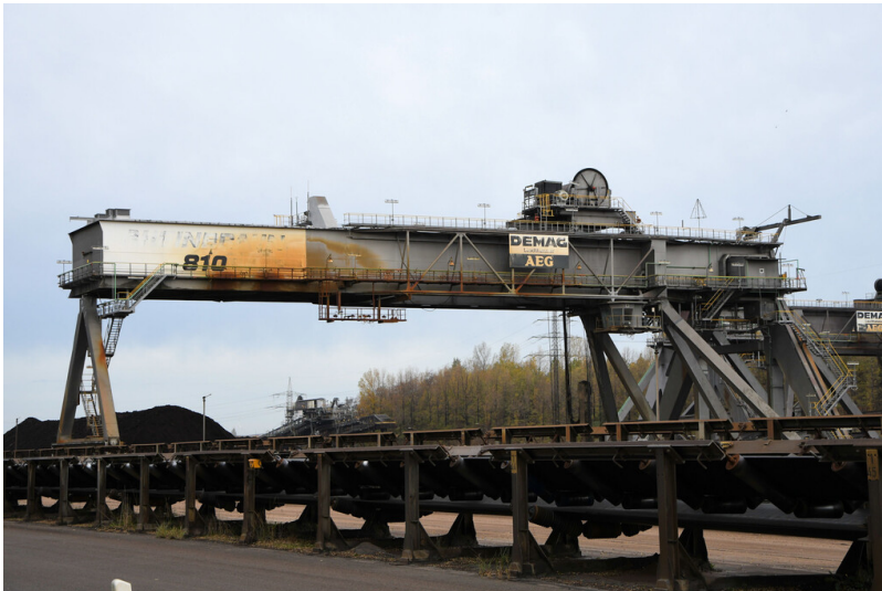
Tagebau Garzweiler: Portalaufnahmegerät 810 im Kohlebunker Garzweiler; Foto: 03.11.2022