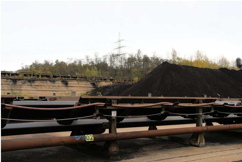
Tagebau Garzweiler: Kohlebunker Garzweiler, Kohlenhalde und stationäre Kohlebandanlage