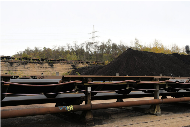
Tagebau Garzweiler: Kohlebunker Garzweiler, Kohlenhalde und stationäre Kohlebandanlage; Foto: 03.11.2022