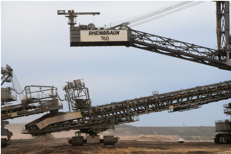
Tagebau Garzweiler: Übergabevorrichtung von Bandschleifenwagen 951 auf das Zubringerband von Absetzer 760; Foto: 03.11.2022