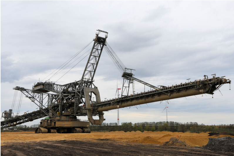
Tagebau Garzweiler: Absetzer 750 mit Rohrausleger