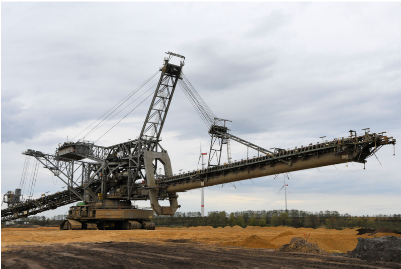
Tagebau Garzweiler: Absetzer 750 mit Rohrausleger; Foto: 03.11.2022