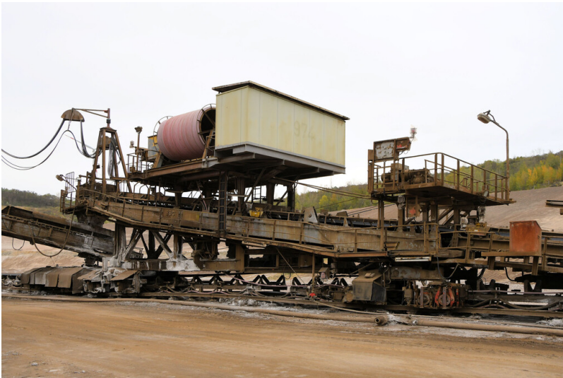
Tagebau Garzweiler: Bandschleifenwagen 974 auf Schienen in der Aschedeponie; Foto: 03.11.2022