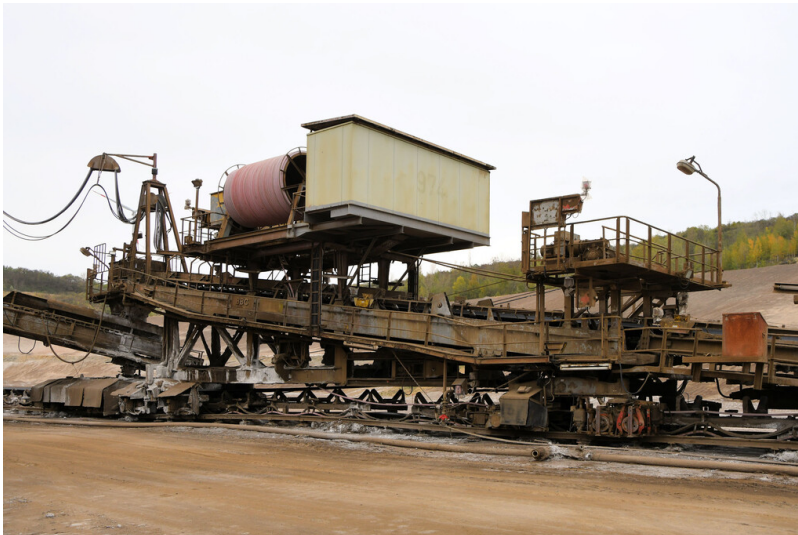
Tagebau Garzweiler: Bandschleifenwagen 974 auf Schienen in der Aschedeponie; Foto: 03.11.2022