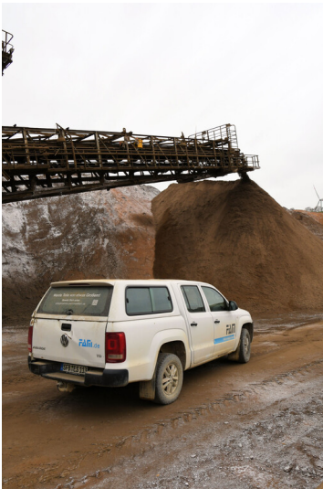
Tagebau Garzweiler: Abwurfausleger von Absetzer 745