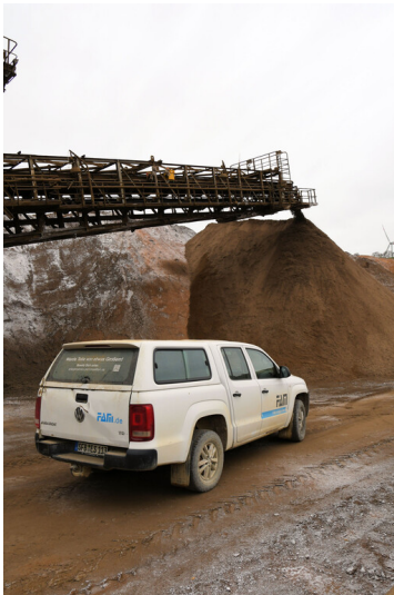
Tagebau Garzweiler: Abwurfausleger von Absetzer 745; Foto: 03.11.2022