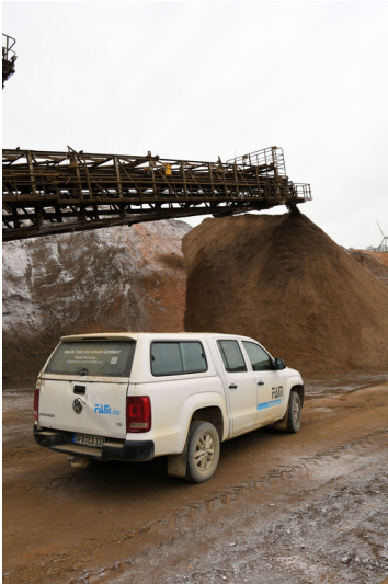
Tagebau Garzweiler: Abwurfslieger von Absetzer 745