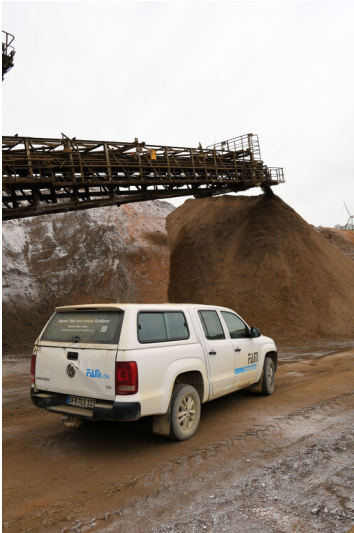
Tagebau Garzweiler: AbwurfAusleger von Absetzer 745; Foto: 03.11.2022