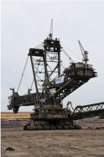
Tagebau Garzweiler: Schaufelradbagger 288