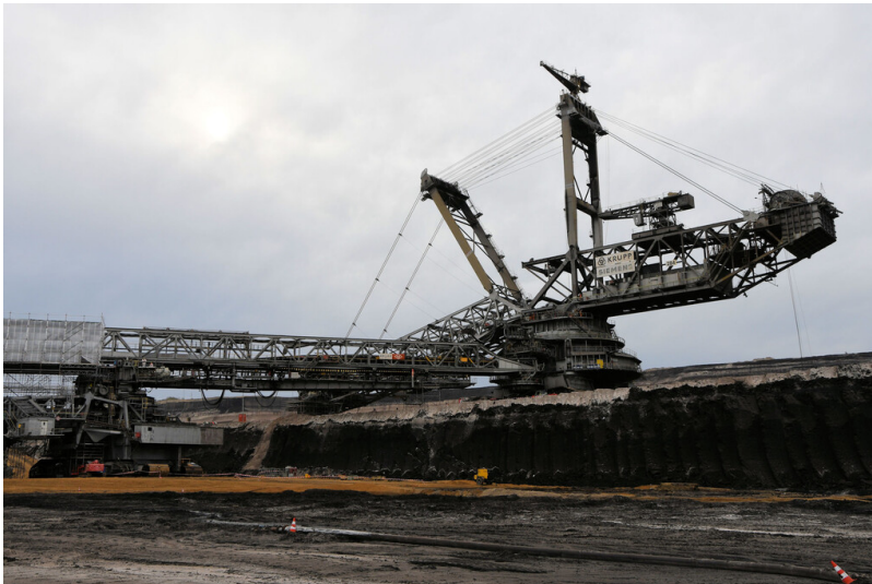
Tagebau Garzweiler: Schaufelradbagger 284 mit Beladewagen unterhalb der Baggerfahrsohle; Foto: 03.11.2022