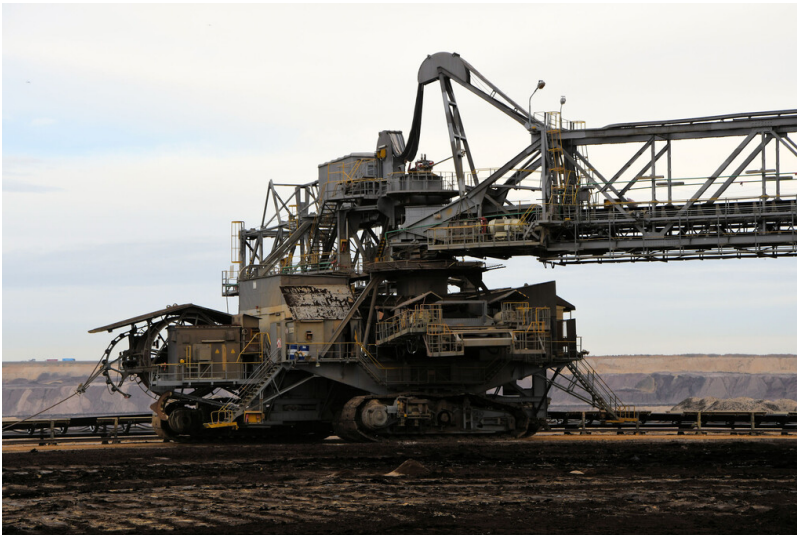
Tagebau Garzweiler: Bandbeladewagen von Schaufelradbagger 258; Foto: 03.11.2022