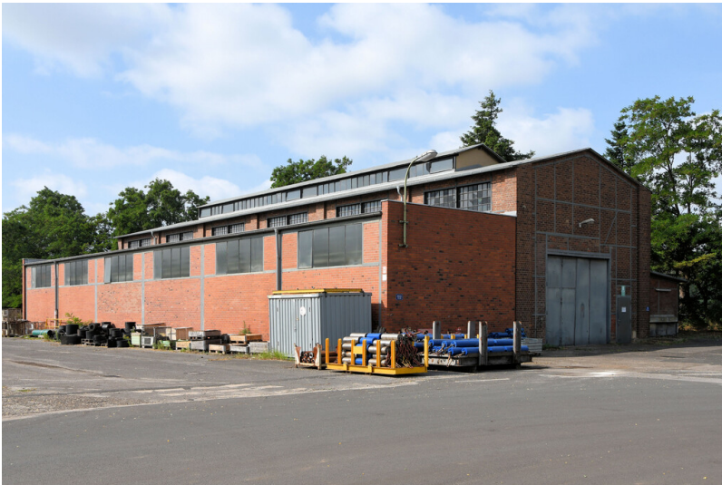
Tagebau Fortuna: ehemalige Vulkanisierhalle, Ansicht von Norden; Foto 26.06.2023