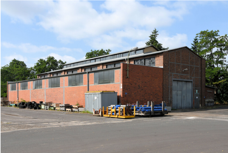
Tagebau Fortuna: ehemalige Vulkanisierhalle, Ansicht von Norden; Foto 26.06.2023