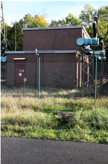
Tagebau Fortuna: 110-kV-Schaltheus der Umspannanlage, Ansicht von Westen; Foto: 09.11.2022