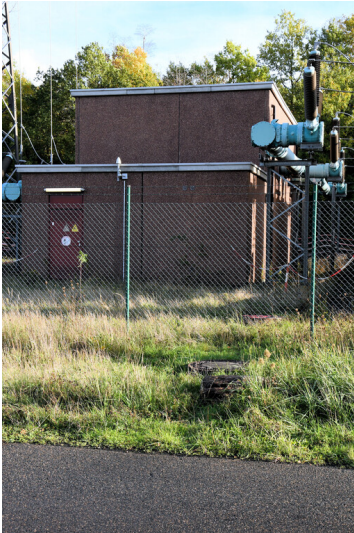
Tagebau Fortuna: 110-kV-Schaltheis der Umspannanlage, Ansicht von Westen