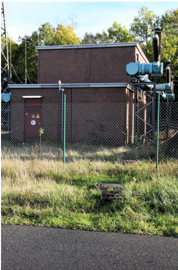
Tagebau Fortuna: 110-kV-Schaltheis der Umspannanlage, Ansicht von Westen; Foto: 09.11.2022