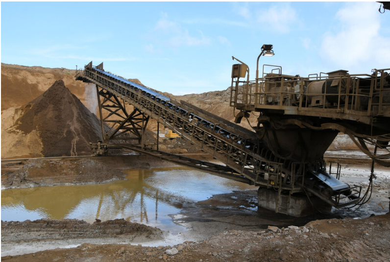
Tagebau Fortuna: Kraftwerksrückstandsdeponie Fortuna, Haldenabwurfband, Ansicht von Südwesten; Foto: 26.06.2023