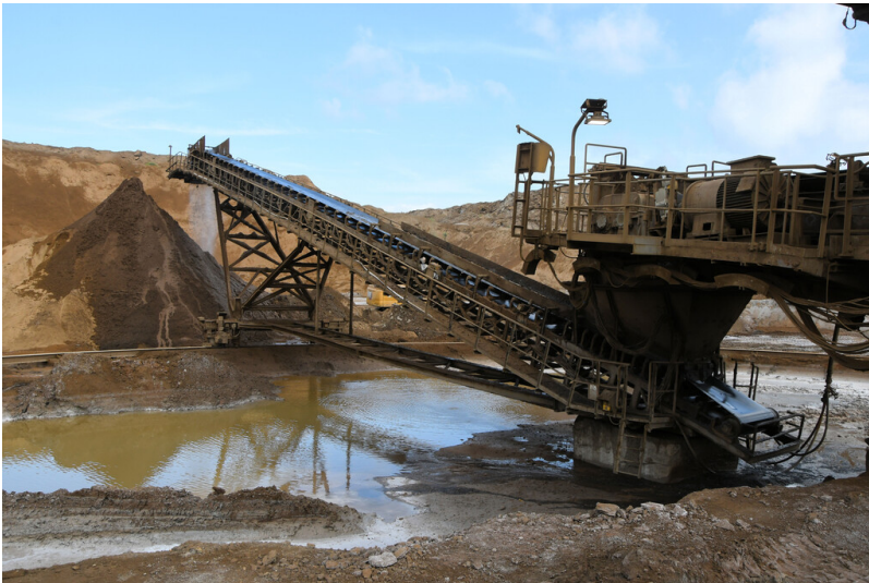
Tagebau Fortuna: Kraftwerksrückstandsdeponie Fortuna, Haldenabwurfband, Ansicht von Südwesten; Foto: 26.06.2023