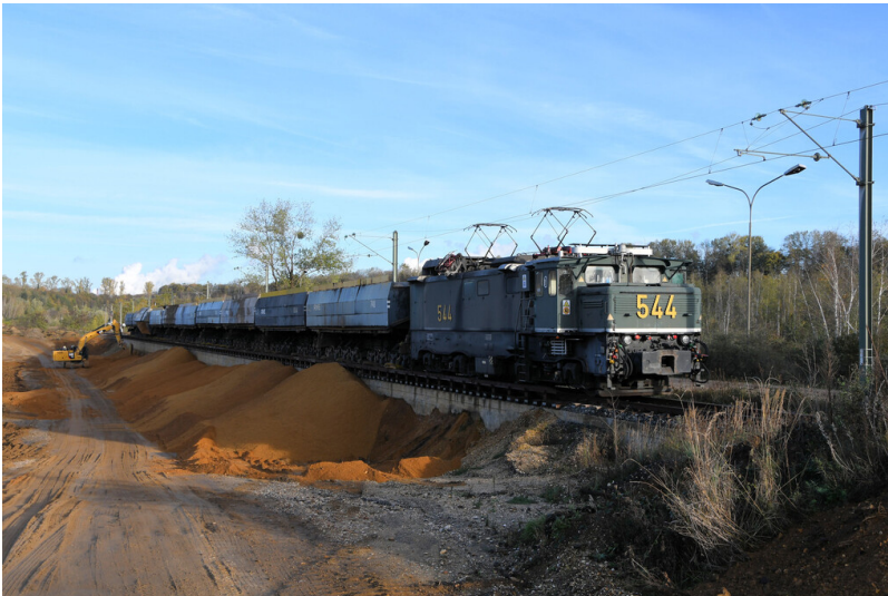
Tagebau Fortuna: Kippgraben 905 mit Abraumzug, Ansicht von Süden