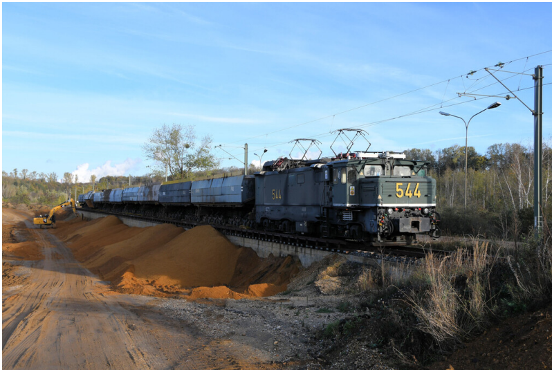
Tagebau Fortuna: Kippgraben 905 mit Abraumzug, Ansicht von Süden; Foto: 09.11.2022