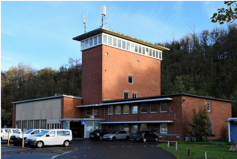
Tagebau Fortuna: Stellwerk +60-m-Sohle, Ansicht von Südwesten; Foto: 09.11.2022