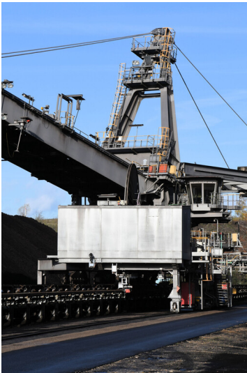
Tagebau Fortuna: Gleisfahrwerk und Schwenkwerk mit Seilstützpylon des Aufnahmegeräts 815, Ansicht von Südosten; Foto: 09.11.2022