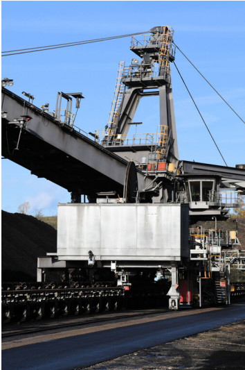
Tagebau Fortuna: Gleisfahrwerk und Schwenkwerk mit Seilstützpylon des Aufnahmegeräts 815, Ansicht von Südosten; Foto: 09.11.2022