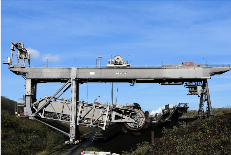
Tagebau Fortuna: Aufnahmegerät 808 im Kohlebunker Fortuna, Ansicht von Südosten