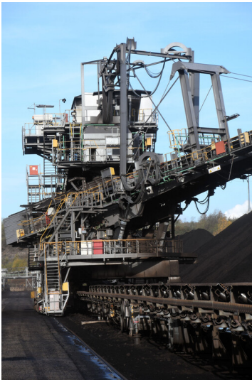
Tagebau Fortuna: Bandschleifenwagens 993, Fahrwerk und Auslegeraufhängung des Absetzerteils, Ansicht von Norden