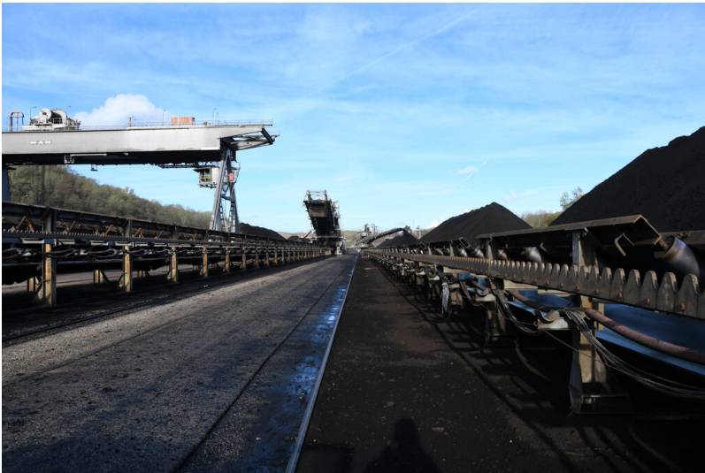
Tagebau Fortuna: Bandschleifenwagen (BSW) 986 (Mitte) im Kohlebunker Fortuna, Ansicht von Südosten; Foto: 09.11.2022