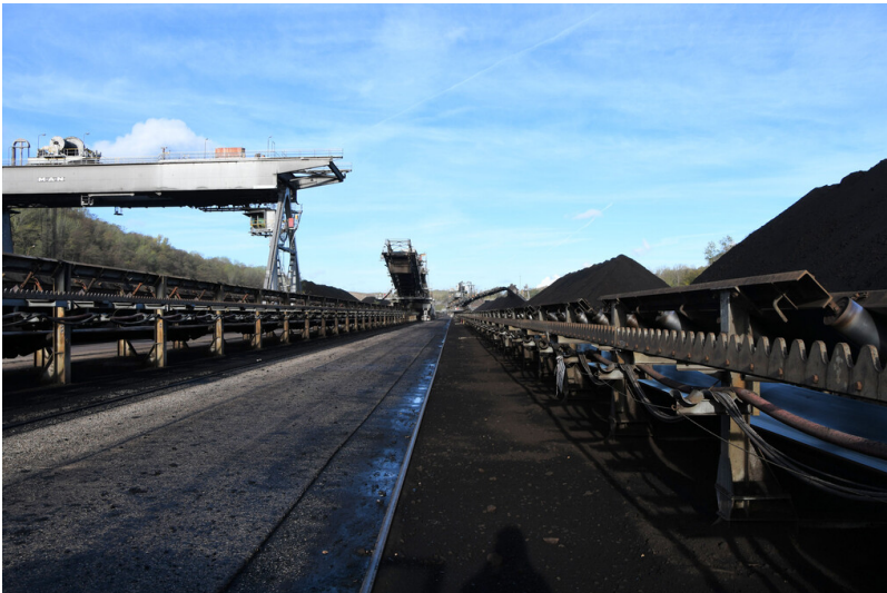
Tagebau Fortuna: Bandschleifenwagen (BSW) 986 (Mitte) im Kohlebunker Fortuna, Ansicht von Südosten