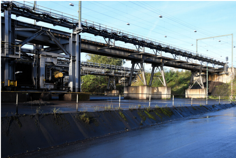
Tagebau Fortuna: Auffahrtbrücken im Norden der ZEL 1, Ansicht von Südosten