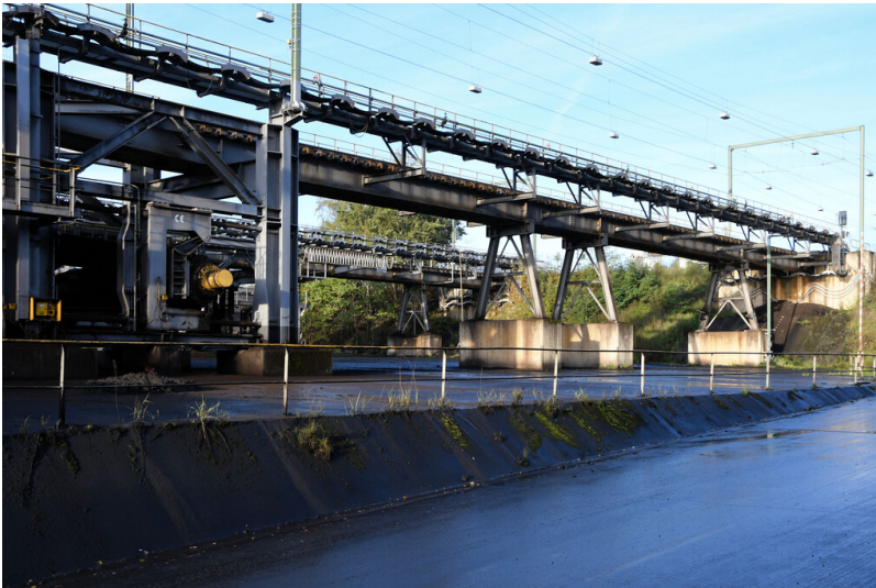
Tagebau Fortuna: Auffahrtbrücken im Norden der ZEL 1, Ansicht von Südosten; Foto: 09.11.2022